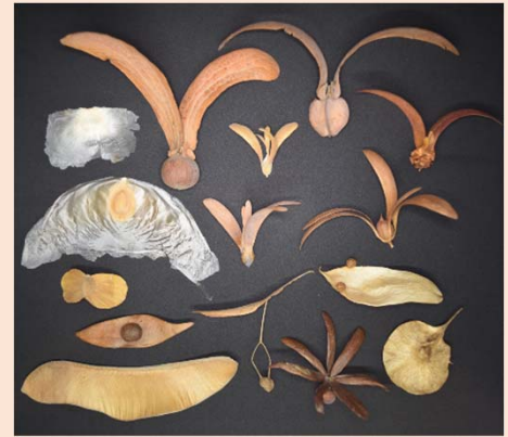
はね たね み 羽やつばさをつけた種・実

※1 予告なく変更する場合があります。 ※2 詳細は、参加者へ別途お知らせします。