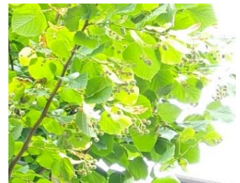
なかま シナノキの仲間 (がいろじゅ (街路樹))